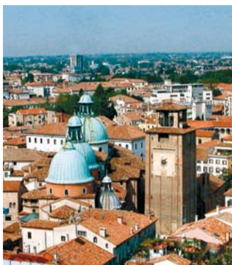
Veduta del centro storico

dipinto che l'artista cadorino dipinse nel terzo decennio del XVI secolo. Apertura: la mattina fino alle 12.00, il pomeriggio dalle 15.00 alle 18.00 (esclusi gli orari delle funzioni).