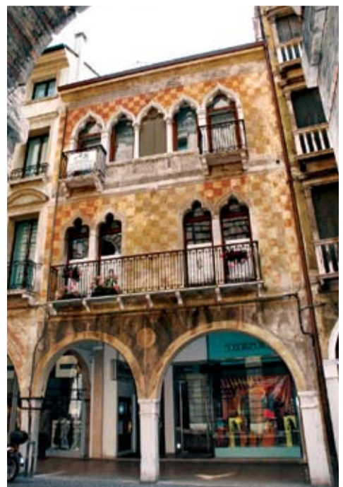
Piazza dei Signori (in alto) Scorcio esterno delle mura e il Sile Porta Santi Quaranta Casa affrescata lungo il Calmaggiore (qui sopra)

Bartolomeo D'Alviano poi contribuirono al loro miglioramento e ampliamento su commissione della Repubblica Veneziana. Ancora oggi sono visibili il terrapieno, rivestito all'esterno da una spessa muraglia di mattoni di quasi 4 km, ed i torrioni circolari, con le cannoniere seminascolte, che ci rammentano del ruolo assunto dalla città quale importante baluardo difensivo ai tempi della Serenissima. Fa sorridere il pensiero che una simile struttura militare rappresenti oggi il luogo ideale per passeggiare e fare jogging, in una suggestiva cornice di verde e acqua. Di forte impatto visivo sono infine le tre splendide porte, San Tomaso, Santi Quaranta e Altinia: quasi un ingresso trionfale nel capoluogo della Marca.